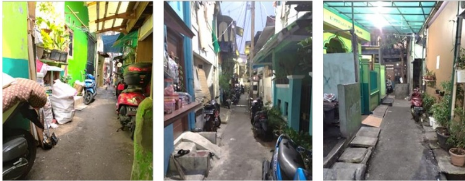
Gbr. 1. Pemukiman RT 014/RW 008 di Jalan Semangka III, Jakarta Barat

Pengabdian kepada Masyarakat pada masa pandemi Covid-19 ini dilaksanakan secara terbatas karena adanya larangan masyarakat untuk berkumpul yang dapat menyebabkan penularan virus lebih cepat. Tim PkM kami terdiri dari 10 orang, yaitu 2 orang dosen Prodi Pendidikan Dokter Gigi, 1 orang dosen Prodi Profesi, 1 orang dosen Prodi MIKG, 1 orang mahasiswa PPDGS Konservasi, 1 orang mahasiswa MIKG, 2 orang mahasiswa Prodi Pendidikan Dokter Gigi, 1 orang alumni, dan 1 orang tenaga penunjang.